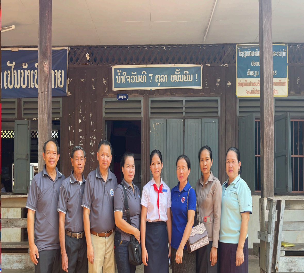
ມອບຂອງຂວັນໃຫ້ໂຮງຮຽນບ້ານໂພນສະຫວ່າງໃຕ້ ແຂວງ ສະຫວັນນະເຂດ