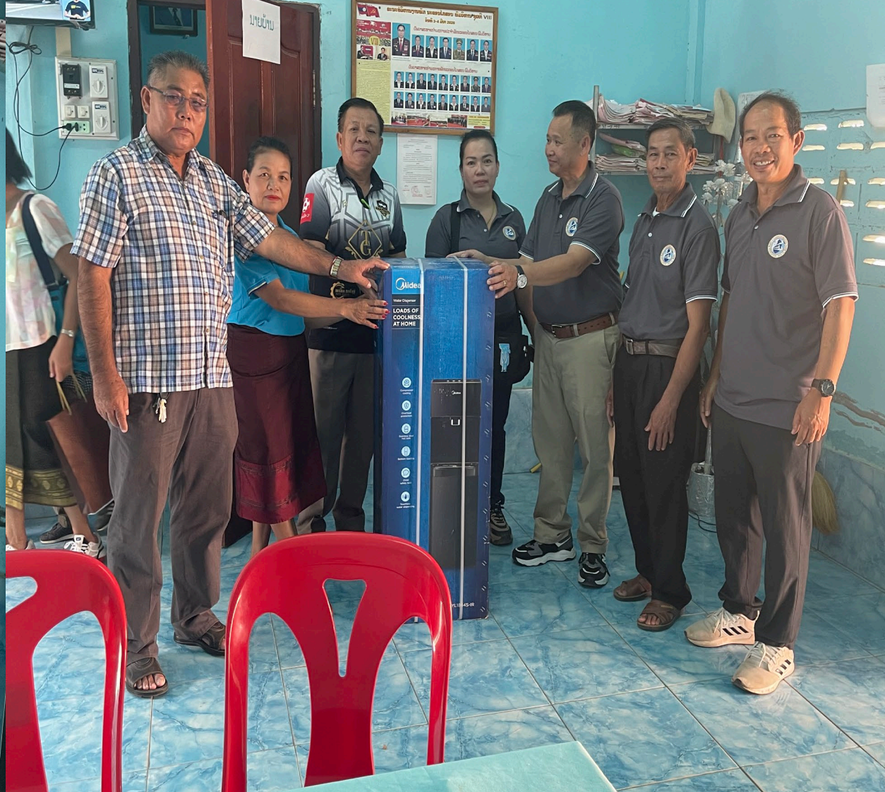
ມອບຂອງຂວັນໃຫ້ອຳນາດການບົກຄອງບ້ານໂພນສະຫວ່າງໃຕ້ແຂວງ ສະຫ້ວນນະເຂດ