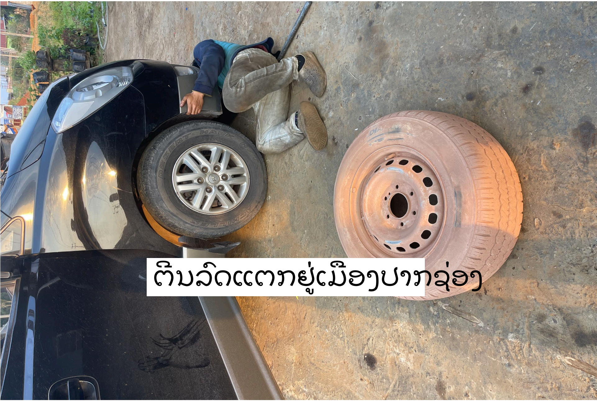
ຕົນລົດແຕກຢູ່ເມືອງປາກຊ່ອງ